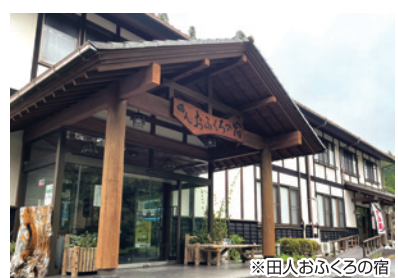
※田人おふくろの宿 旬な食材を使った福島の郷土料理や天然 水を使用したお風呂で1日のしめくくりを!