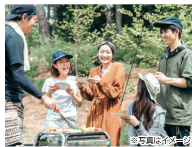
※写真はイメージ BBQで交流を深めよう!