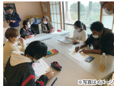
※写真はイメージ ミニワークショップ!地域の皆さんと一緒に いわき田人の課題と未来を考えよう