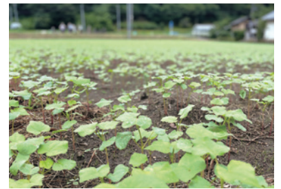
8月時点のそば畑 ツアー当日は大きく育ったそばの収穫体験 を実施