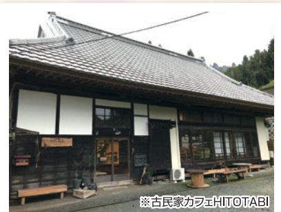
※古民家カフェHITOTABI 築150年以上のオシャレな古民家カフェで 地元の野菜を使った料理を堪能♪