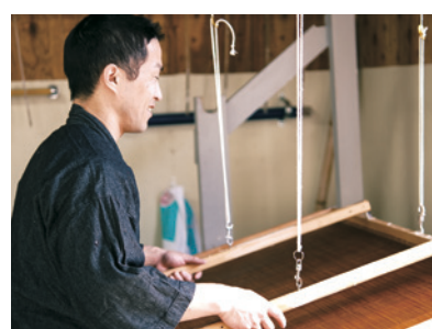
遠野地区の伝統工芸「遠野和紙」の紙漉きを体験